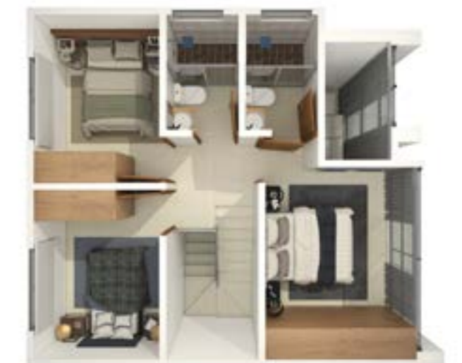
Vista Superior Planta Alta