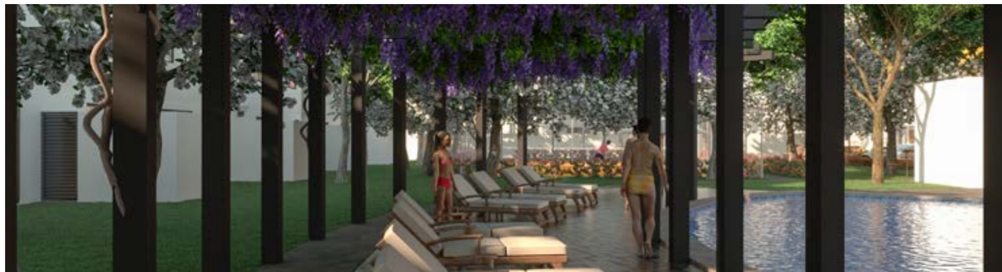
Área de Camastros con Pérgola