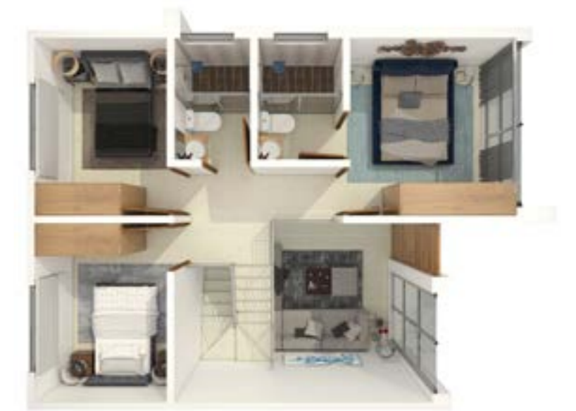
Vista Superior Planta Alta