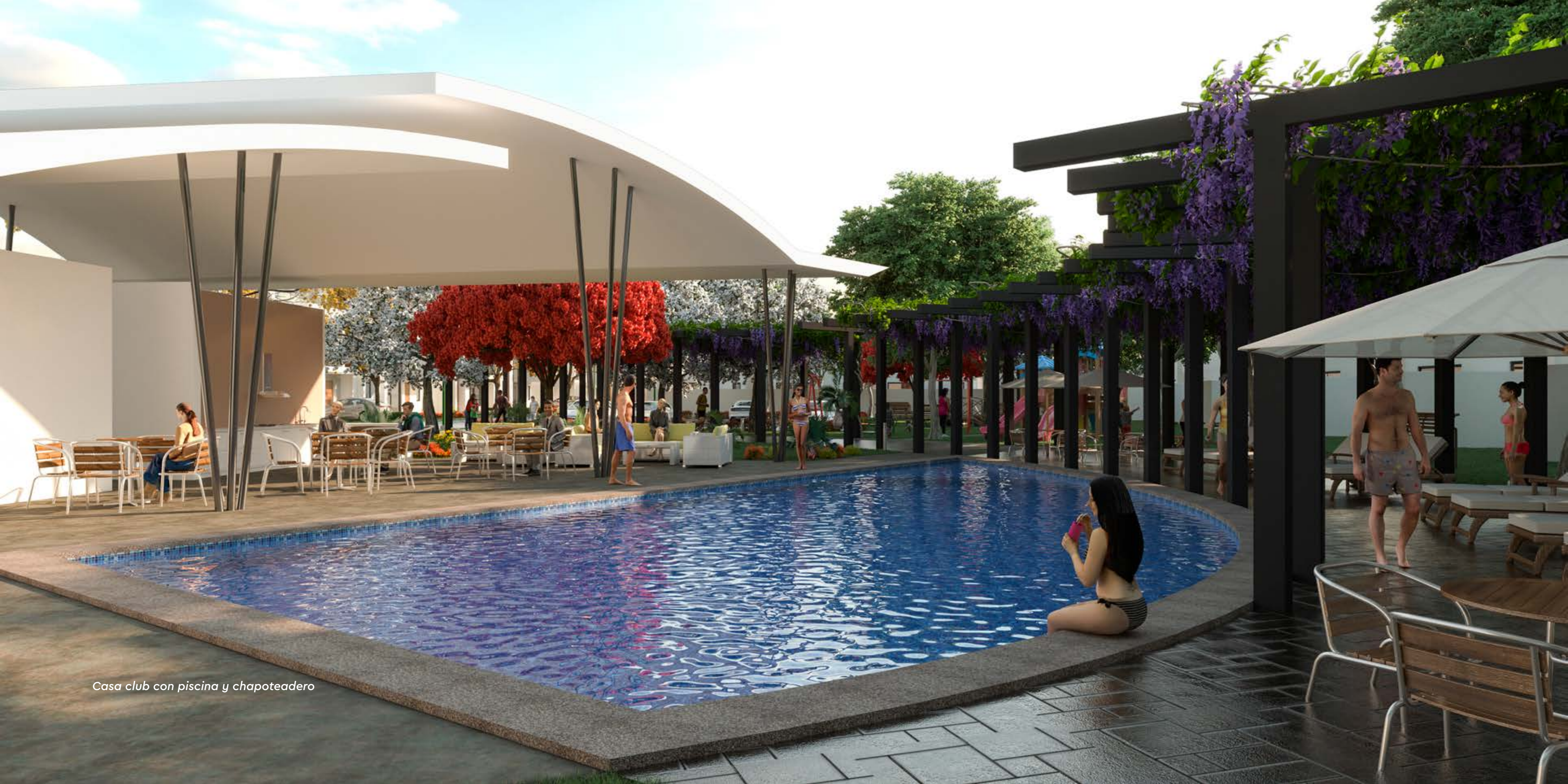
Casa club con piscina y chapoteadero