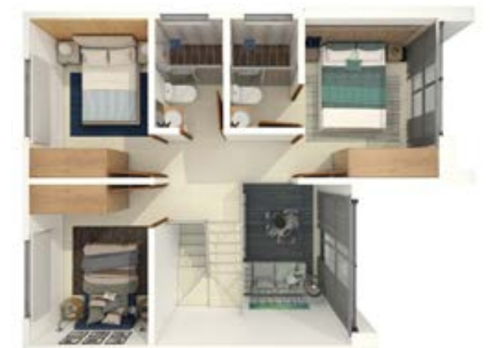
Vista Superior Planta Alta