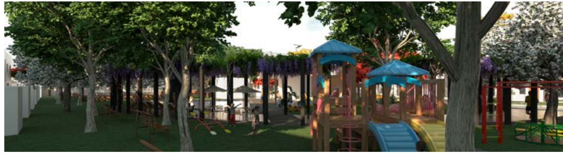
Área de Juegos Infantiles