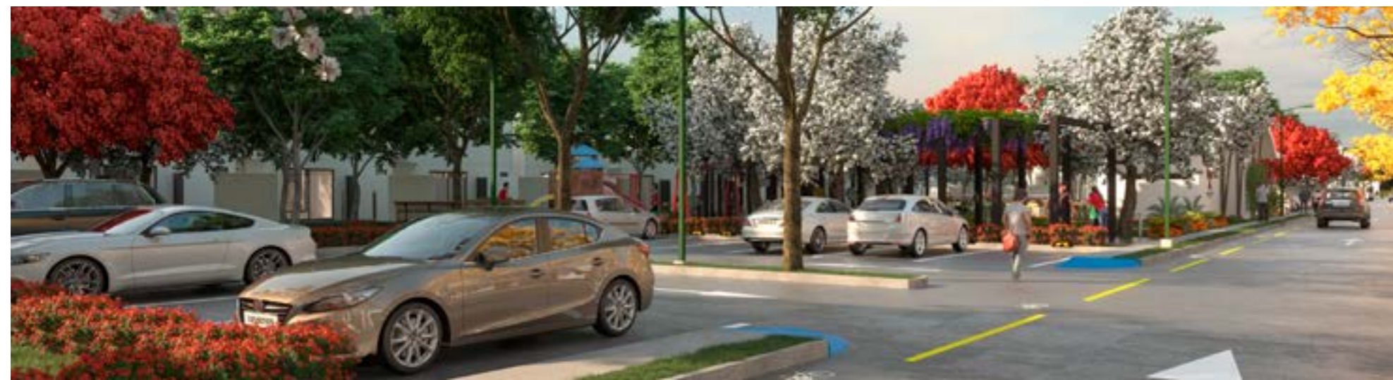
Estacionamiento para Visitas