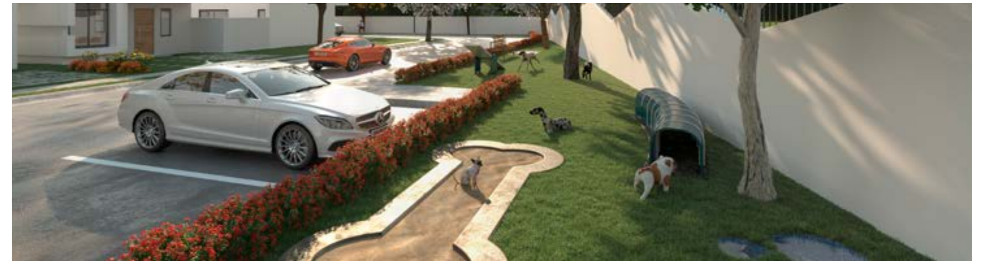
Área para Mascotas