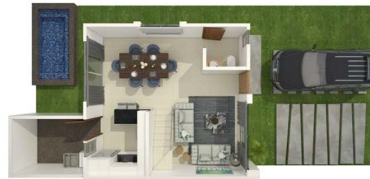
Vista Superior Planta Baja