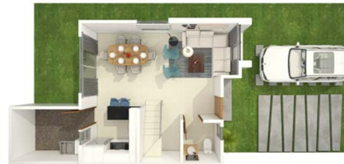
Vista Superior Planta Baja