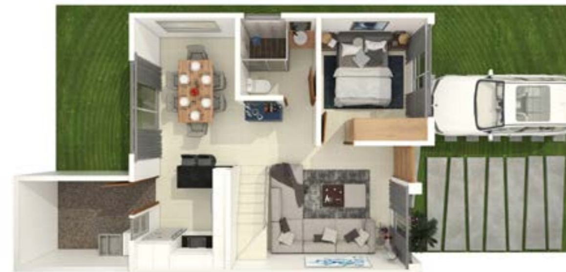
Vista Superior Planta Baja