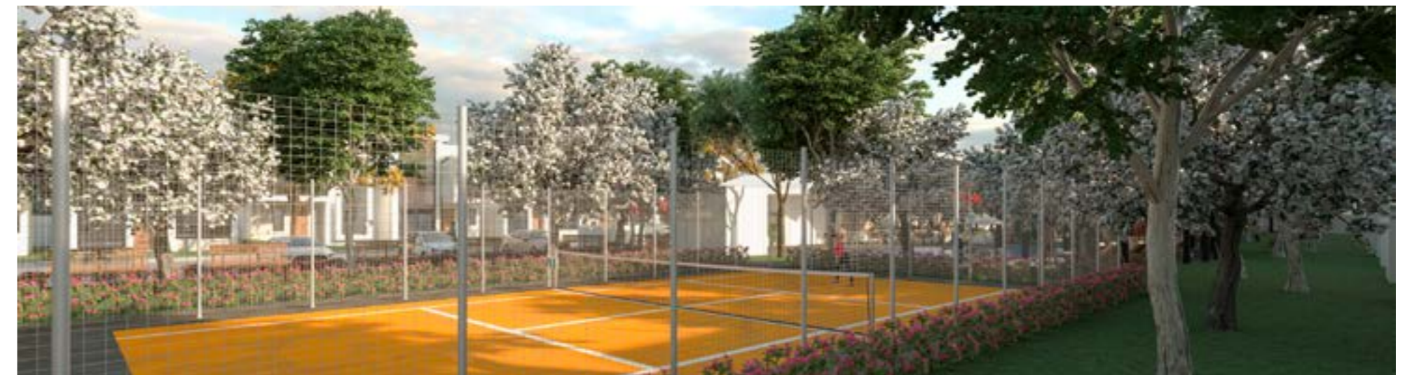
Cancha de Tenis