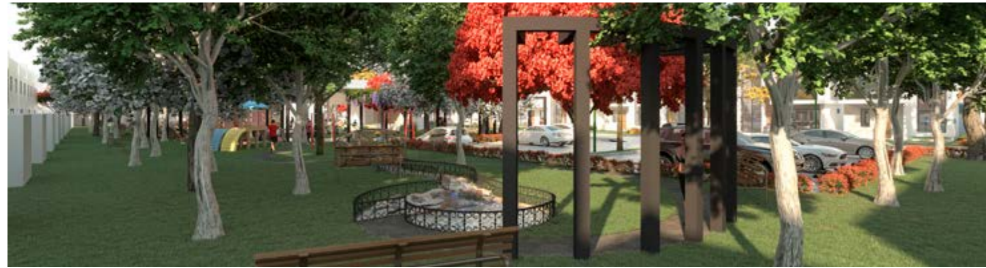
Área de Relajación